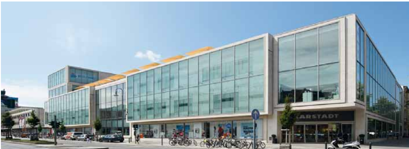
Le Boulevard de Berlin avec produits Hörmann, certifié BREEAM