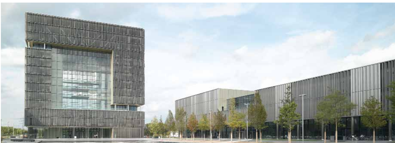
Quartier ThyssenKrupp à Essen avec produits Hörmann, certifié DGNB Gold