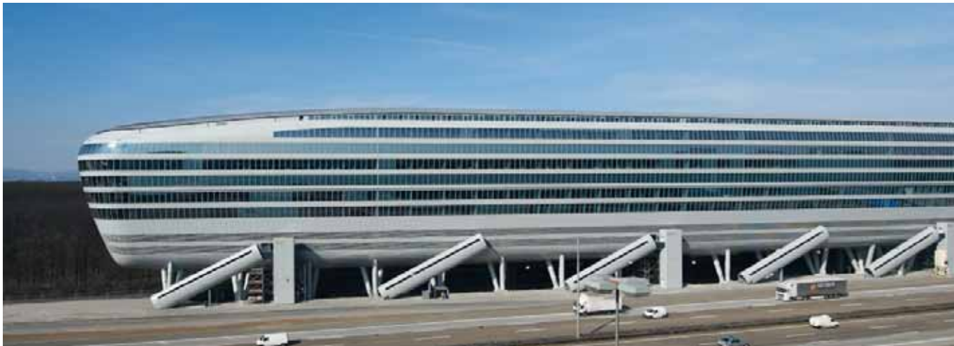
"The Squaire" à Francfort-sur-le-Main avec produits Hörmann, certifié Leed Gold